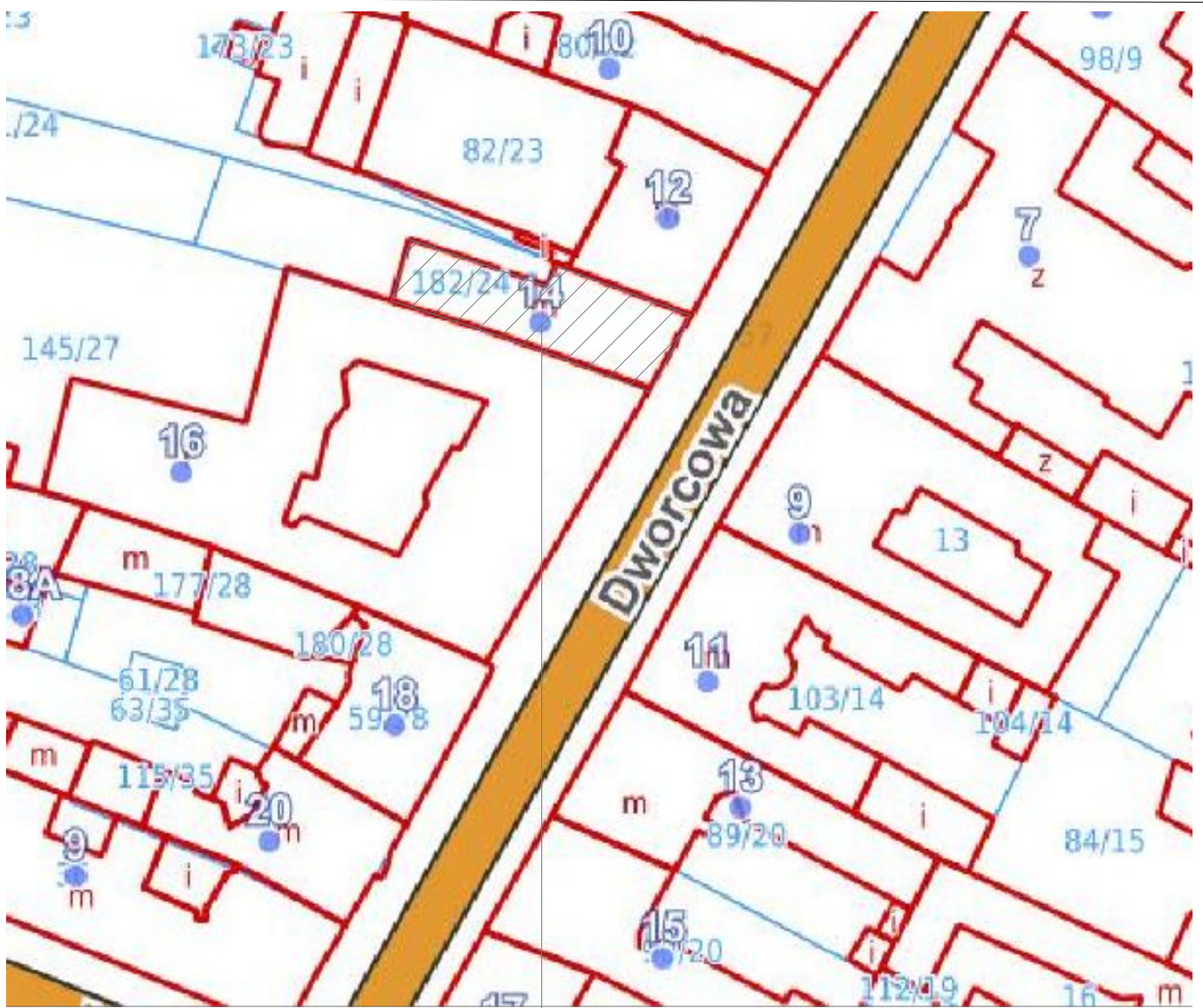
BUDYNEK UL. DWORCOWA 14